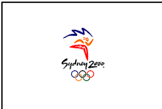
シドニー五輪旗 by Zach Harden (FOTW)